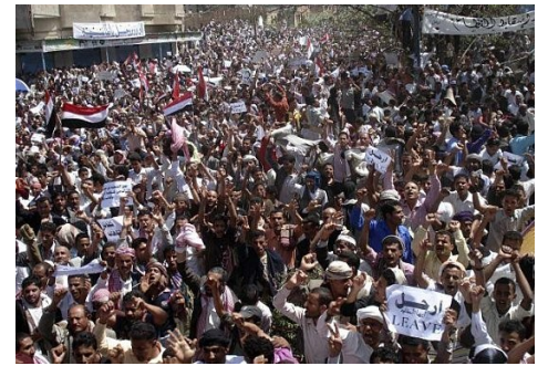
Manifestation au Yémen

Il est certain que nous, occidentaux, n'espérons aucunement qu'al-qaida ne trempe derrière ces soudaines révoltes populaires. Nous souhaitons un véritable accès à la liberté, celle où l'on peut parler, travailler, s'éduquer, voter, manger. Il va sans dire que nous sommes très choyés ici. Nous avons même tendance à prendre pour acquis notre liberté, notre démocratie. Il arrive que nous n'allions point voter, alors qu'on se contente de se plaindre de nos gouvernements. Il arrive également que nos enfants quittent l'école trop tôt alors qu'ils y ont plein accès gratuitement. Puis, il arrive qu'on ne s'intéresse pas aux faits politiques et sociaux car nous sommes trop occupés à consommer, à compétitionner entre nous et à jouir, inconscients, de nos conditions de vie enviables tout en dormant au gaz!!! Nous sommes si bien que nous laissons nos élus gouverner à leur guise