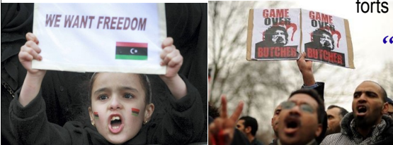
La mobilisation de la Libye

Consoeurs, confrères, secouons-nous un peu, allons voter et démontrons au reste du monde que nous ne sommes pas en train de devenir un pays trop à