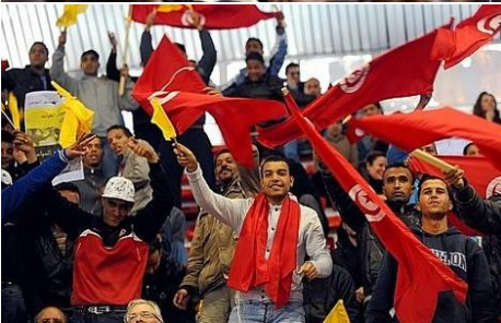
La révolte de Tunisie